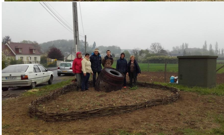
Rotation demandée, selon trace au sol ...